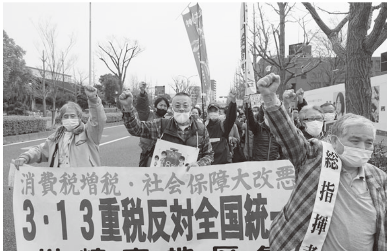
「消費税率を5%に引き下げ、生活と営業を守れ」と川崎南税務署に向かう川崎支部の仲間

神奈川県内の各自治体と地元建設組合との「災害時協定」の締結は、12市1町となりました。