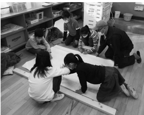
職人さんに指導を受ける児童たち

た。児童たちは、苦勞しながらも、職人さんの指導で設計図を描き、いろいろな道具を使ってペンチを完成させました。児童たちからは、「普通の授業ではできない体験ができた」「すごく楽しかった」などの感想が寄せられ、ものづくりの楽しさを実感したようです。なかには「大人になつたら神奈川土建さんに行つて体験してみたい」という児童もいました。先生からも、「職人