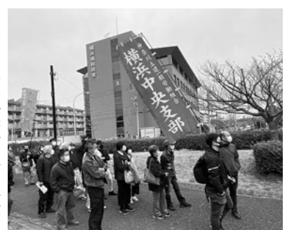
集会に参加する横浜中央支部の仲間