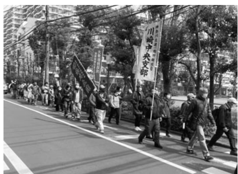
川崎北税務署へ向かう川崎中央支部の仲間