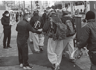
マスク・ティッシュ・チラシの3点セット配布で現場前宣伝(川崎駅西口開発計画・大成建設現場前)

て高望みする賃金ではありません。大手企業の利益を現場で働く技能者に還元させ、CCUSを用いた技能・経験が反映される賃金水準を確保していくことが大きな課題となっています。