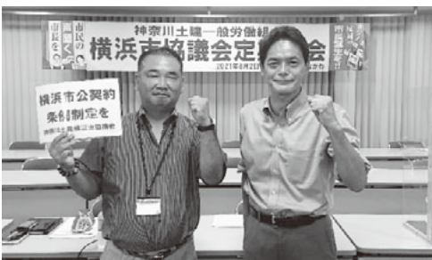
山中横浜新市長(右)と勝利を誓う荒井議長

横浜市長選挙で神奈川土建横浜市協議会が支持決定をした山中竹春さんが50万6392票を獲得し、見事に当選を勝ち取りました。山中勝利に尽力いただいた全ての皆さんにお礼申し上げます。今後、組合は仲間の声を市政に活かす取り組みを強め、仕事と暮らしを応援する横浜市づくりに奮闘します。