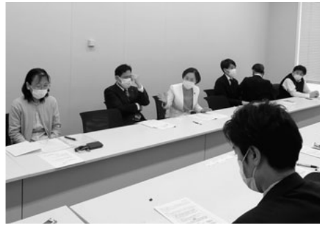
国交省・厚労省職員との懇談の様子

厚労省からは、 ①職場復帰の際、PCR検査陰性証明の提出を控える通知を出し周知している。 ②全国の労働局へ、再度