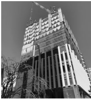
大林組元請の「LG横浜イノベーションセンター」建設現場

神奈川土建では、2020年から2021年にかけて、首都圏の組合と協力し、コロナ禍の現場問題に関して多くのゼネコン・住宅企業に対し、