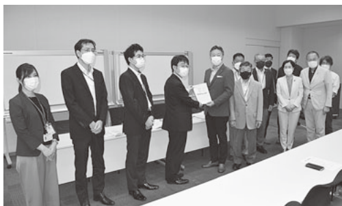
財務省へ要望書を手渡す

今私たちが求めているのは、持続化給付金と家賃支援給付金の複数回以上の再給付です。コロナ禍による受注減のみならず、ウッドショックやメタルショックによる仕入れ価格の高騰により仲間を取り巻く営業と雇用はかつて無いほどの苦境に追い詰められています。また、コロナ支援対策と最低賃金の引き上げに合わせた中小企業への支援