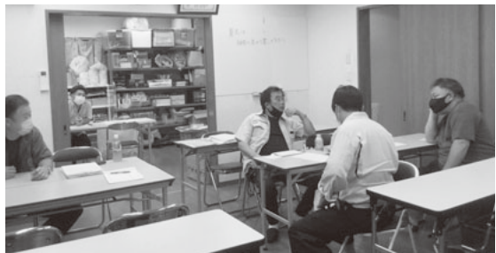
普通の会話にも現場の悩み相談