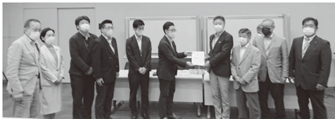
中小企業庁へ要望書を提出する仲間

実な要求です。休業や時短営業を求められている業種の皆さんの経営が安定し、新規の設備投資を行うのはまだ先のことです。コロナまん延防止対策の措置が解除されても、私たちの経営環境が直ちに回復するわけはありません。