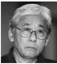
傍聴した座間副委員長

労働報酬審議会とは、「事業者代表」、「労働者代表」、「学識経験者」の計6人の委員で構成され、労働報酬下限額について調査・審議します。その労働者代表として、相模原支部・中間書記長が委員を務め、労働者の処遇改善に奮闘しています。審議会で審議した労働報酬下限額は市長へ答申され、令和4年度の労働報酬(賃金)下限額が決定、告示されます。公