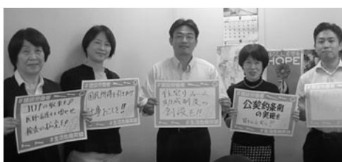
浦信祐(参・公)、阿部知子(衆・立民)、後藤祐一(衆・立民)、青柳陽一郎(衆・立民)、中谷一馬(衆・立民)、早稲田夕季(衆・立民)、牧山弘恵(参・立民)、畑野君枝(衆・共)、笠浩史(衆・無)、近藤大輔(県議・無)、寺崎雄介(県議・立民)、日本共産党県議団 ※敬称略