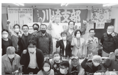
拡大と選挙のW勝利が合い言葉

今秋の月間は組織強化と拡大の両方を意識した方針で奮闘し、1007人の新しい仲間を組合に迎えました。目標には届きませんでした。取り組みの教訓を来春の月間で生かし、年間2%実増で組合を大きく強くしよう。