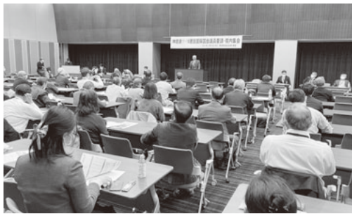
国庫補助金獲得のために駆けつけた仲間

今月間を通じ、組合員に寄り添い、組合員の要求を実現できるこの組合をもっと多くの建設職人に知ってもらいたいと思