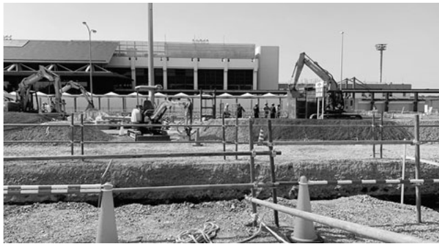
熊本国際空港新旅客ターミナル建設工事現場の様子

元請、「熊本国際空港新旅客ターミナル建設工事」について、「仮設トイレが現場から遠く困っている、増設してほしい」と9月中旬、公式LINE