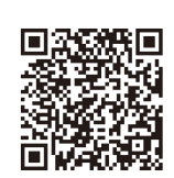
公式LINEはここから登録

現場で改善要望をヒアリングすることになった。と連絡がありました。11月に入り、なかなか仮設トイレ