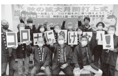
仲間の笑顔が何よりの喜び

訪問前は「り患したことをあまり知られたくないのではなか」と不安視しましたが、申請した組合員からは、「コロナ