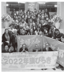
大好きな仲間と久しぶりの集合写真

新型コロナウイルス感染症の拡大を受け、直前で来場できなくなった方もいましたが、72名の参加で旗びらきを行うことができました。参加した仲間からは「お酌ができなかったり立ち歩けなかったり、今年の旗開きには制約があるけれど、去年開催できなかったのだから、とにかく旗開きが開催出来たという事が嬉しい!」「仲間の顔を久しぶりにたくさん見れた!」「今回初めて旗開きに参加させて頂きましたが、新年から仲間が集まれる組合って良いところですね」等々、参加者して良かったという仲間の喜びの声が多く上がりました。 春の拡大月間を前に多くの仲間が集まると、意義ある旗開きとなりました。