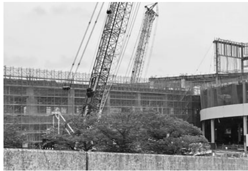
DPL横浜戸塚建設工事現場の様子

神奈川土建は、首都圏の組合と協力し、コロナ禍の建設現場の環境改善運動を続けています。今回は、横浜戸塚区