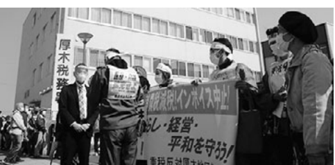
重税反対統一行動の様子