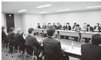
大成建設と交渉する神奈川土建の仲間

20年6月に開設された神奈川土建公式ラインの登録者数が1000人を突破しました。