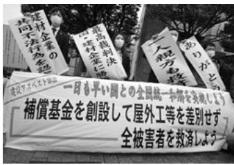
最高裁判判決を告げる旗出し

スト含有建材の使用を推進したのは国の責任であり、施工や現場施工者に負担を強いること自体が筋違い。除去費用の補助