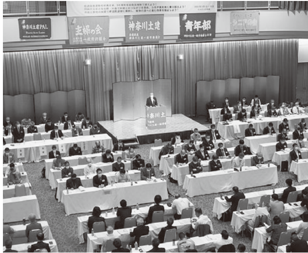
大会会場を小田原ヒルトンホテル(根府川)に変更して開催された本会議場の様子

神奈川土建一般労働組合は5月15日から16日、小田原ヒルトンホテルにて第51回定期大会を開催しました。310人の参加者による2日間の討論を通じて、新年度運動方針と新中央役員を満場一致で採択しました。↓関連②・③面