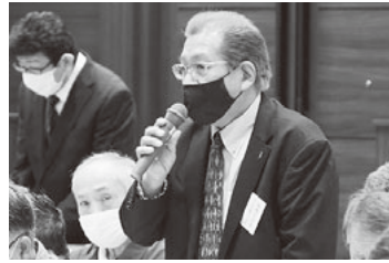
取組み報告をする内野代議員