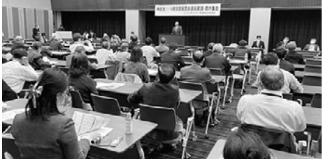
建設国保国会議員要請の様子