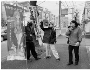
ハンドマイクで住宅デー宣伝(横浜)

町場の職域防衛、仕事興しについて、医療生協の新聞に折り込みチラシを入れて大きな反響を得た経験や支部主催の祭り