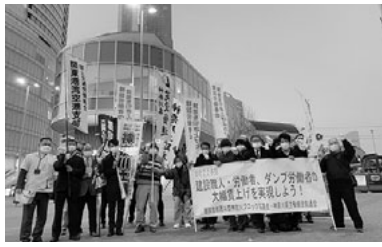
建設首都圏共闘・桜木町宣伝の様子

行われました。日常的な世話焼き活動を通じた信頼関係の深まりが、賃金というデリケートなアンケートを増やす要となる