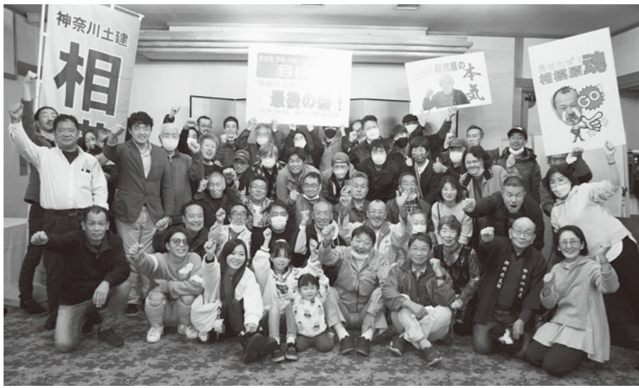
打上げ式で目標達成の喜びを分かち合う