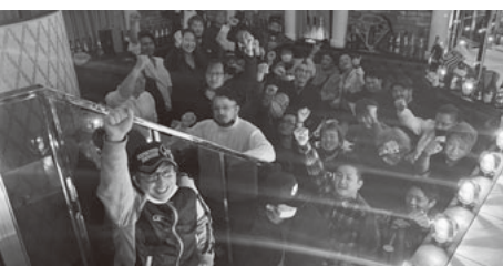
今までに無い雰囲気の中で乾杯

11月19日、インペルダウン横浜で、秋の拡大月間打上げ忘年会を開催しました。11支部34人が参