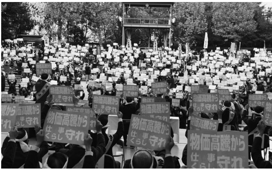
予算要求中央総決起集会に1703人が参加

れ」を要求項目に加えました。集会決議には「現場で働く仲間の賃金・単価の引き上げは、まさに一刻の猶予もならない」と盛り込まれ、物価上昇を止める賃金単価の大幅引き上げ、来年度予算での建設国保の現行水準確保を国に要求することを意思統一しました。さらに、この苦境でも後継者育成は待ったなし、CCUSを国による法的位置づけと普及促進を求めました。