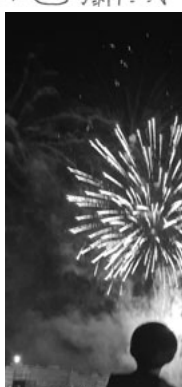
うれしいサプライズ花火