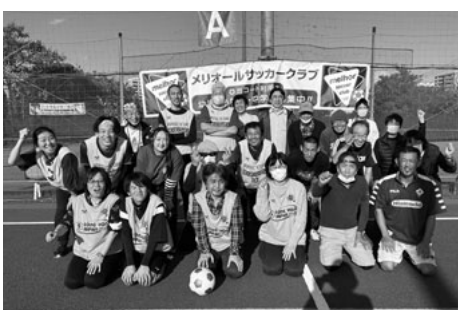
とても疲れたけど楽しかった!