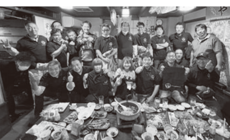
満を持しての結成総会

西相支部定期大会で真ん中の世代(40〜64歳)を結集しようと提起され、6月から各分会から壮年部結成メンバーを募り、計3回の準備会を重ね、積極的な意見が様々出されました。11月6日に壮年部が工作教室(開成町)に取り組み、主要メンバー6人で成功させ、その夜に地元、鴨宮駅前の「ホルモンだいご」で結成総会を開催し20人が集まり大変盛り上がりました。「新しい仕事の仲間ができてうれしかった」「これからも飲み会を続けていきたい」と大好評でした。現在は46人が参加。壮年部の中から分会・支部の活動を担う新役員誕生に期待されています。