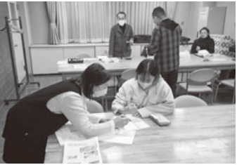
要請ハガキも書いてもらいます

地区センターの会議室で行われている合同群会議におじゃましました。会場に入ると会計さんが3カ所に分かれて個人用の会計で別々に納入