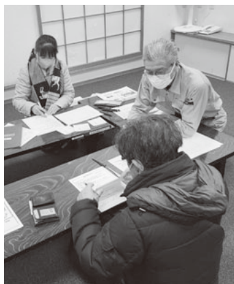
群長さん一人ひとりに丁寧に説明

会場は地区センターの和室を2部屋かりて1、3群の合同群会議です。中に入るとテーブルが2つあり、それぞれ群長・