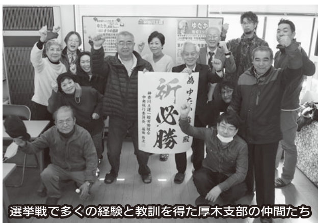
選挙戦で多くの経験と教訓を得た厚木支部の仲間たち

莫大な地元負担と 陥没の危機が現実 国と県が一体になって 暴走しようとしているリニア中央幹線の問題では、税金の無駄遣いに切り込むことが重要です。相模原市が進める駅の周辺整備だけでも事業費は538億円。市民の税金が投入されます。川崎市北部を大深度地下トンネルが通る計画で、陥没事故の危険が現実の問題として起こります。 国から悪い政策の波が押し寄せてきたら県民を守る防波堤になるのが地方議会の大切な役目です。県知事選挙・統一地方選挙で私たちの要求を