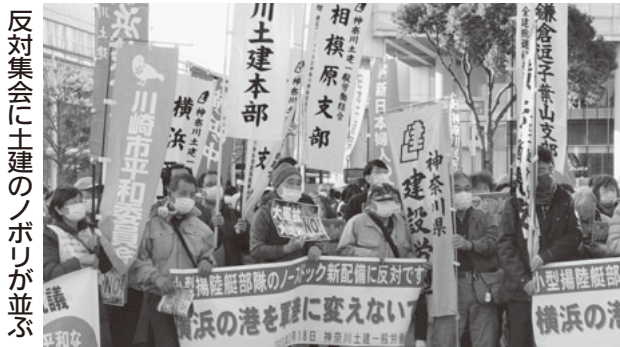
反対集会に土建のノボリが並ぶ

そして塩と上手に付き合っていくには、塩選びも大切です。日本は海に囲まれているため海水由来の塩が多く作られています。海水由来の天然塩にはナトリウム他にマグネシウムやカルシウムという血管を守るミネラルも含まれています。ぜひ、海水由来の天然塩を選びましょう。岩塩も天然塩なのでおすすめです。