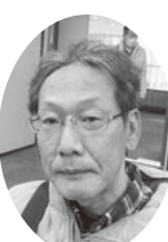
ハラスメント自体の問題点やその構造が提起された講習でした。