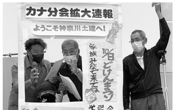
仕上げの生写真で速報完成

は一切無し。手作りの分会拡大速報とお笑いがあるテーマです。頑張る仲間の姿を素早く共有できる分会速報は、運動の前進に欠かせないツールですが、ハードルが高いのも事実です。紙面構成のルールや手書き文字、写真撮影など尻込みしてしまふ要素がたくさんあります。