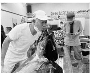
ちょっと気の早いウイニングキス

す。組織活動者会議の後の交流会では、新パンフを基に総合共済を始めとする諸制度の〇×クイズを行い、楽しみながら理解を深めました。