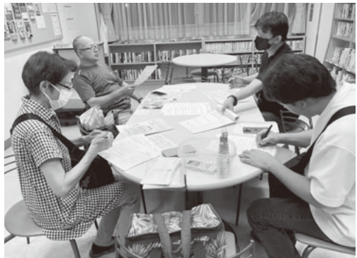
距離の近さが温かい群会議

今回お邪魔したのは横浜支部の大倉山分会4群です。大綱中学校コミュニティハウスで行われていた群会議に参加してきました。会場が中学校の敷地内なので、駐車場の心配はいりません。駐車場の確保に苦労している群が少なくない中、恵まれた環境で会議が出来ることをうらやましく思いました。会議室に入ると既に群会議は始まっております。群長さんが大切なお知らせを組合員に説明しているところでした。本に囲まれて落ち着いた雰囲気、4人の仲間がテーブルを囲んで、税金への不満や現場の出来事に花を咲かせています。「周りの仲間もインボイス制度に怒っている」「CCUSカードを持っていない、現場に入れない、仲間がいた」「一部の大手企業ばかりが儲かる、優しい群会議でした。」