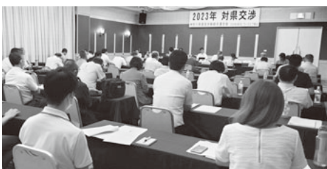
緊迫する交渉会場

神奈川土建が加盟する神奈川県建設労働組合連合会は9月5日、横浜市内で神奈川県との交渉を実施し、働くものの立場から要求を訴えました。