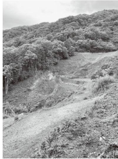
山肌を削り滑り落ちた土石流跡

まだ記憶に新しい一昨年の7月3日、午前10時半に発生した熱海市伊豆山の盛土崩落災害の被災現場へ視察に行ってきた。15年にもわたって違法に盛られた建設残土