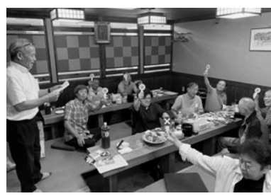
〇×クイズで制度学習

す。組織活動者会議の後の交流会では、新パンフを基に総合共済を始めとする諸制度の〇×クイズを行い、楽しみながら理解を深めました。