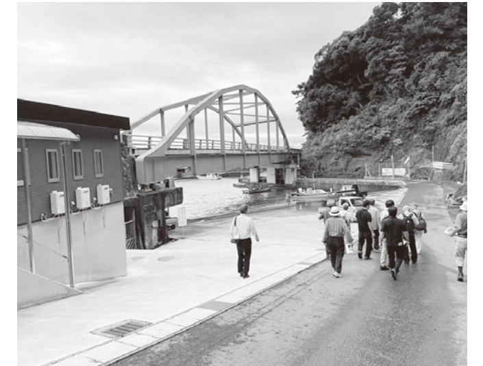
土石流が到達した伊豆山港

二日目に視察は、土砂の起点から約2km離れた伊豆山港海まで到達した土石流の被害を確認するため現地へ向かいました。大破したシャワー室や詰め所は伊豆山漁業会と支援者の尽力で再建され、漁場再生と観光復興への歩みを感じることが出来ました。