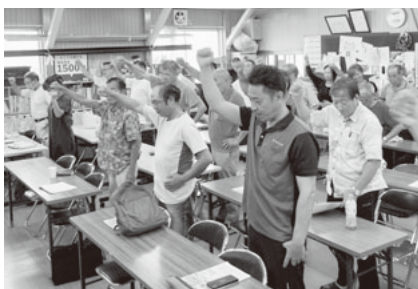
意思統一の団結ガンバロー

秋の組織拡大月間に入った9月3日、午前と午後に分けて群役員会議と組織活動者会議が開催されました。午前の群役員会議では会場に入りきれない程の47人名が集まりました。「役員学習会トラの巻」の説明の後、4グループに分かれて分散会を行いました。それぞれ活発な議論がされ、役員負担が多く、一般組合員さんの協力が必要との意見が多く出されました。午後からは分会5役が参加して組織活動者会議と出陣式が行なわれました。組織部長から事業所対策・組織強化・後継者育成の課題に関する行動提起が行われ、力強い決意表明で団結を固めました。