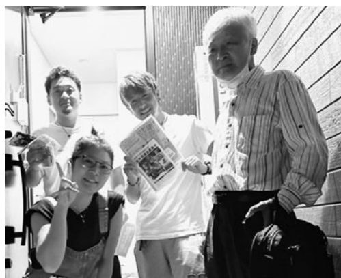
青年部と分会役員が協力して訪問(相模原)

組織強化拡大月間がスタートし、組合員宅や事業所への訪問対話が広がっています。所得に応じた保険料設定がきめ細かくなった建設国保の説明や労働基準法遵守への対応状況など、仲間の疑問や相談に足を使って寄り添っています。