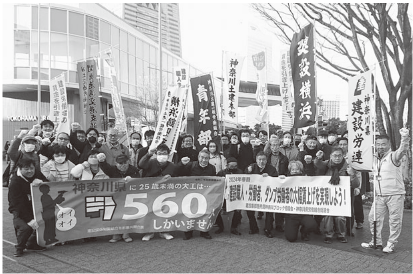
そろいの黄色い軍手を突き上げてガンバロー