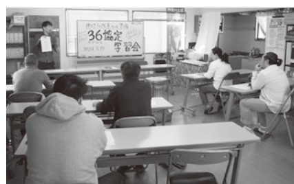
真剣に講義に聞き入る仲間

4月から始まる時間外労働の上限規制や36協定届の学習会を3月17日に開催しました。分会ごとリストアップされた事業所を優先的に訪問し、直接チラシを渡して受講を呼びかけたところ、5事業所が参加しました。参加者からは、「土曜日も仕事だから協定書をださないとだめだ」「労働時間をしっかり把握することがまず大事なことだった」「直接に対応は厳しいが会社を存続させるためには必要なことだ」などの感想が寄せられました。全体での学習会が終わった後に、具体的な働き方を確認しながら、各自で36協定書を作成しました。