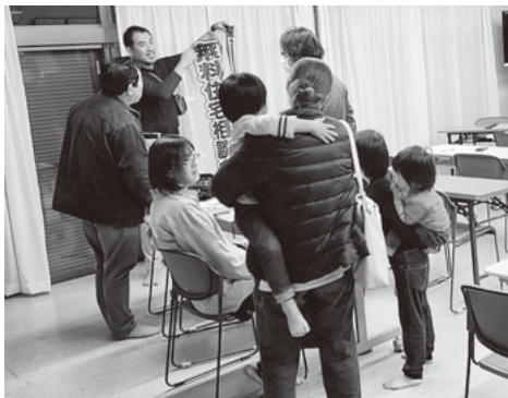
会話の輪ができる群会議

会場は地域の自治会館を利用して開催しています。みんな席に座って読み合わせがスタート。群会議の話題や支部通信・分会通信までも読み合わせることに驚きました。分會通信は、簡易な分会新聞のようなもので、分会総会の案内やイベントなど、今後の予定が記載されています。