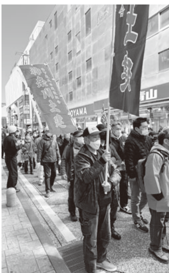
シュプレヒコール上げデモ行進

印が廃止される」とし、納税者の権利を無視する税務行政のあり方が告発されました。各界からの報告では、インボイス制度の弊害や年金財源を削ぐの軍拡など、政治に対する怒りが訴えられました。集会後に税務署までデモ行進を行い、集団申告をしました。