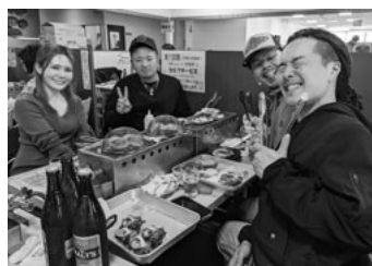
海鮮バーベキューに舌鼓

横浜中央支部は3月17日、いちご狩りバスツアーを137人の参加で開催しました。同支部は組合員の6割以上が事業所の事業主と従業員が占めています。一方で、支部や分会役員は個人事業主や一人親方で構成されており、分会で話しても置かれていない環境や要求が異なるため話題がかみ合わず、声がかけづらい状況が続いていました。この事態を打開すべく、事業所の仲間へバスツアーの参加を積極的に呼びかけました。その結果、家族を含め16人が参加してくれました。