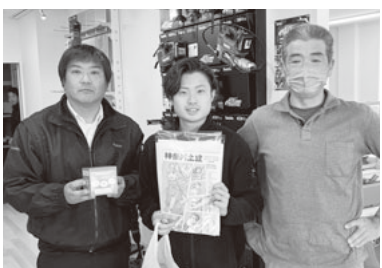
世代の垣根を越えて行動

分会役員と青年部が一緒に行動して結びつきを作り出す「青年部デー」を組織部と青年部が共同し、3月10日に実施しました。入学祝い金の給付対象となる組合員を特定して訪問し、申請方法などを案内しました。また、ホワイトデーに因んでお菓子を持参し、子どもたちに手渡しました。共済制度の利用を通じて、青年・子育て世代に組合の優位性を知らせました。この他に雇用のルールを学ぶ事業所セミナーも紹介しました。