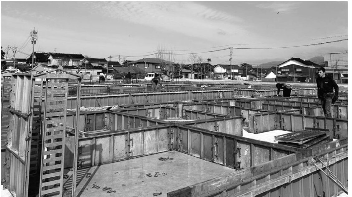
4月1日から大工工事予定の鳳至小学校の基礎工事の様子(3月24日撮影)

4月1日以降、全体で300人規模の就労体制が整います。鳳至(ふげし)小学校、珠洲市3団地、旧七浦(しつら)小学校グラウンドでの大工工事が始まります。神奈川土建からは合計23人の大工が労働者供給事業を通じて、現地の工務店に就労します。一方で、被災地の環境は今も過酷な