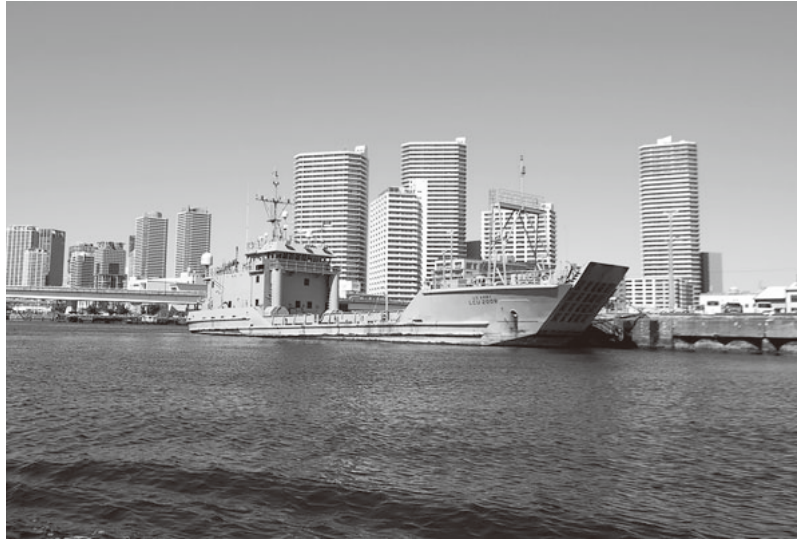
マンション群を背に停泊する大型揚陸艇カラボザ